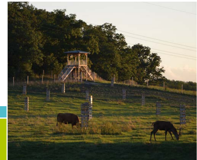
Blick auf den Aussichtsturm über die Hutungsfläche

Die Hutungsfläche in Hellmitzheim wird von den Weidetieren aktiv gestaltet. Durch die Beweidung entsteht eine strukturreiche Wiese Kurzgras – Hochstauden. Sowohl das Rotwild, als auch das Gelbvieh, (alte Hausrindrasse) nutzen den eingezäunten Wald und schaffen hier durch Verbiss und Tritt Strukturen, die im Wirtschaftswald so kaum noch zu finden sind. Am Waldrand entsteht durch die Beweidung eine halboffene Landschaft – Lebensraum für zahlreiche Schmetterlingsarten. Auf den Liegeflächen und Trittstellen entstehen durch die dauernde Nutzung durch die Tiere Rohbodenstandorte, die z. B. von verschiedenen Insektenarten, wie Sandbienen, besiedelt werden. Dunghaufen als Nahrungsquelle locken ebenfalls Insekten an. Die Wasserstelle für die Weidetiere ist gleichzeitig ein Amphibienhabitat, z. B. für die Gelbbauchunke. Die alten Huteeichen sind reich an Spalten und Höhlen. Halsbandschnäpper und Fledermäuse finden dort Unterschlupf und auf der insektenreichen Hutefläche reichlich Nahrung.