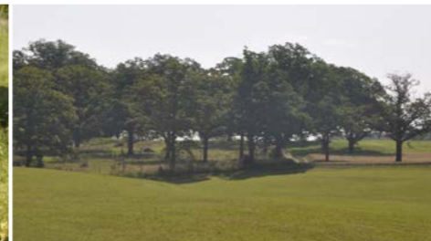
Hutewaldrest mit ca. 200 Jahre alten Eichen